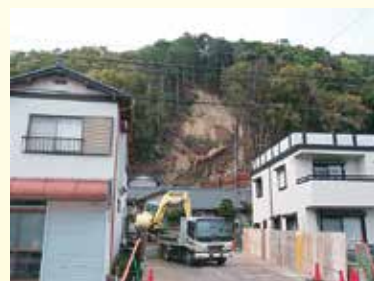
急傾斜地崩壊対策