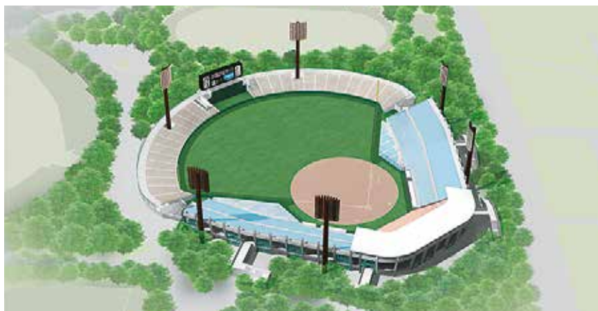
○6月リニューアル工事完成予定の草薙総合運動場硬式野球場イメージ