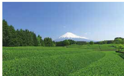
富士山世界文化遺産登録推進事業